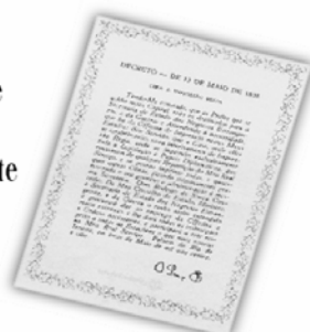
Replica do Decreto de 13 de maio de 1808.

...a Imprensa Nacional foi criada através do Decreto de 13 de maio de 1808, assinado pelo Príncipe Regente D. João, com o nome de Impressão Régia e seu objetivo era o de imprimir, com exclusividade, todos os atos normativos e administrativos oficiais do governo?